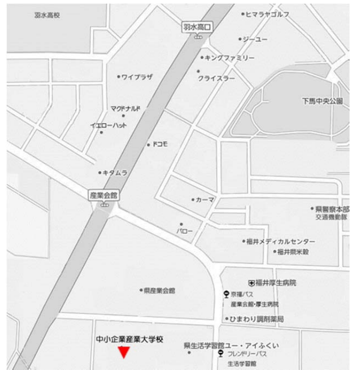
中小企業産業大学校 (福井市下六条町 16-15)